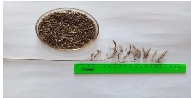
Метелка, семена и внешний вид посевов сорта «Восход»